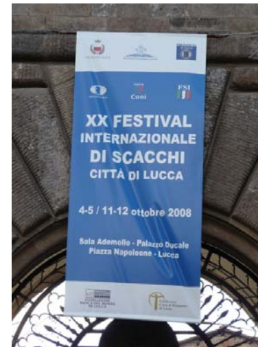
FOTO TORNEO DEL VENTENNALE