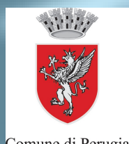
Comune di Perugia