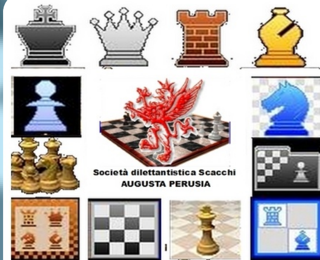
Società dilettantistica Scacchi AUGUSTA PERUSIA