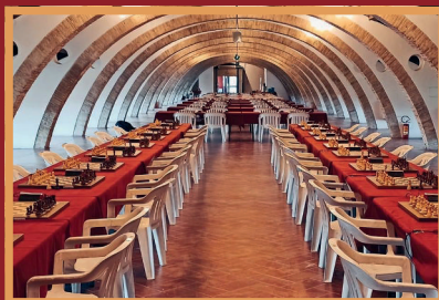
Sede di gioco, Ex Caserma Napoleonica Montesanto