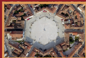
Piazza Grande vista dall'alto